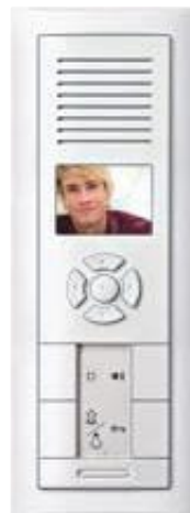
TwinBus Video- freisprechstelle UP im ELSO Joy-Design

Schneider Electric bietet hierfür die passenden Lösungen, denn mit Ritto Gebäudekommunikationstechnik hat Schneider Electric einen starken Partner und Spezialisten im Bereich der intelligenten Gebäudekommunikation. Dies sind perfekte Voraussetzungen, um Ihren Kunden einen echten Mehrwert zu bieten.